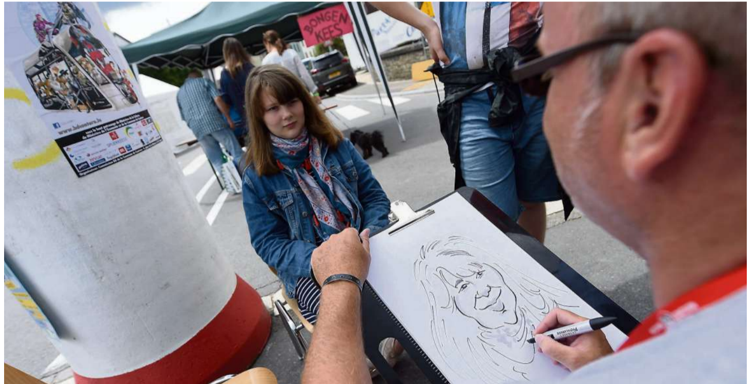
Parmi les nombreuses animations, les caricaturistes ont fait le plein