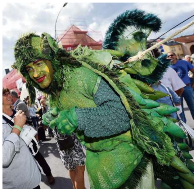
Les cosplayers ont apporté leur touche de fantaisie