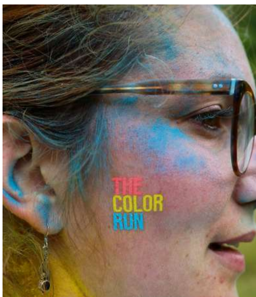
La course a lieu partout dans le monde

La «Color Run» a animé le lac d'Echternach samedi