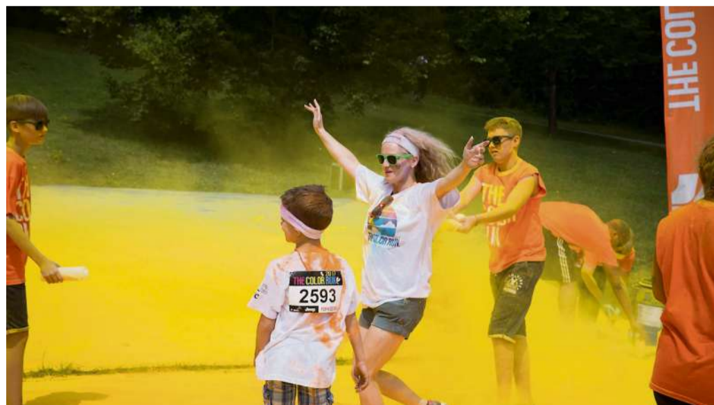
Les participants en ont vu de toutes les couleurs