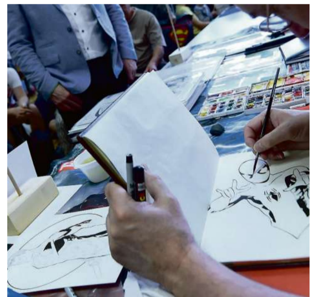
Les visiteurs ont fait le plein de dessins et dédicaces